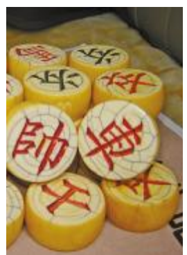
李鸿章赠给马家的象棋

主办方北京鸿尊文物鉴定中心昨日透露,在鉴定的藏品中真品的比例不超过10%,仿制品、普通而没有收藏价值的物品居多。主办方提醒民间收藏爱好者注意,要提高对文物艺术品的鉴赏能力,避免损失。