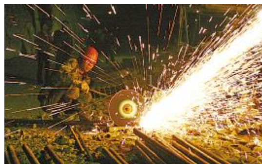
工人切割钢条准备救援